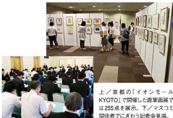
上/京都の「イオンモールKYOTO」で開催した直筆画展では255点を展示。下/マスコミ関係者でにぎわう記者会見場。

ひ とつは、前号の「特集」や「JPICだより」でもお知らせいたしました「絵本作家・児童文学作家による直筆画・メッセージ展示会&オークション」です。国内外130名もの作家から250点を超える作品を提供いただきました。多くの方にご覧いただき、入札もしていただきました。オークションは、8月末までJBBYのホームページ ( http://www.jbby.org/ )でも受け付けています。ご希望の方はお急ぎあれ! あなたの大好きなあの作家さんの直筆画が手に入るうえ、その収益金が「被災地の子ども読書活動支援費に充当される」なんて、美しいシステムではありませんか!!