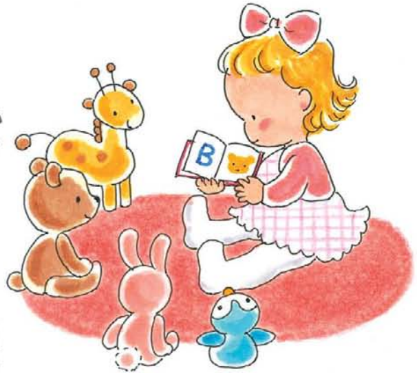
イラスト/梅津 裕子

JPIC 読書アドバイザーとして、小・中学校を中心に読みきかせやブックトークを実施。公共図書館非常勤司書になったのを機に、ボランティア養成講座など、子どもにかかわる大人への支援を通じ、読書環境を整える活動に従事している。