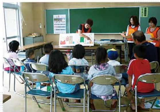
宮城県南三陸町の公民館で行った「心の絆」プロジェクト。メンタルヘルスケアのお話のあとは、おはなし会を楽しんでもらいます。

ふ たつめ。被災地での読みきかせ活動支援。医療界と協力した「メンタルヘルスケア」心の「絆」プロジェクトで、お医者さんの「メンタルヘルスケア講演」と読書ボランティアによる「おはなし会」をセットで巡回。7月下旬から9月上旬にかけて60カ所程度の施設で実施予定。6月中旬から7月中旬には、読書ボランティアのみなさんを対象に「被災地でのボランティア活動における留意点」などをプログラムに含めた「集い」を3回開催しました。また、「各読書ボランティアの自主的な活動の