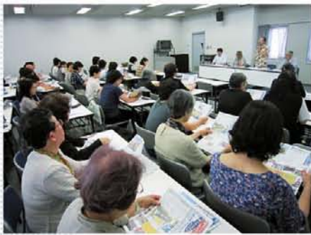
“集い”では、被災地でのおはなし会の留意点や、子どもの本にかかわる作家が「本の大切さ」について話します。

なかで、図書や本棚を必要としている施設があれば、東京からお送りします」という態勢も整え、「東京では把握できない、地元読書ボランティアとの協力関係によるこまやかな状況把握、サポート対応」ができる運営を図っています。弊誌読者からの情報提供やサポート要請もお待ちしております。 実際に活動されているみなさまからは、「それぞれの被災者や子どもたちによって、置かれている環境は違い、当然、優先順位も違います。『まだまだ本なんて』という状況の方もたくさんいらっしゃいますが、本を読んであげると、子どもたちは本当に喜んでくれます。周囲のお友だちや大人とゆったりとした時間を共有できることで、安心するのでしょね」との声も多数。これが、本、ものがたりの力ですね。